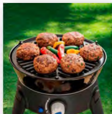
Gasgrill Cadac Safari Chef