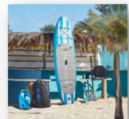
Stand Up Paddle