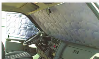
Thermomatten gegen Hitze und Kälte