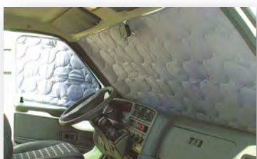
Thermomatten gegen Hitze und Kälte