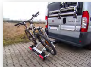
Atera Strada DL 3