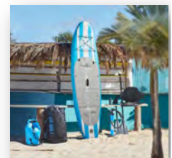
Stand Up Paddle