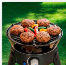
Gasgrill Cadac Safari Chef